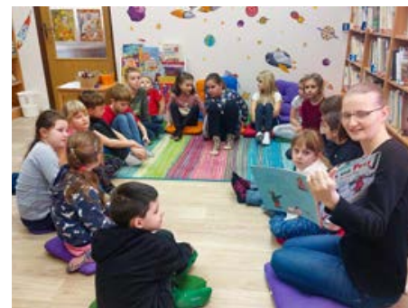
Meet Up v knihovně aneb děti se seznamují s angličtinou.

Pro všechny cestovatele proběhnou dvě besedy (Albánie a Irsko). V červnu se těšíme na velmi vzácné hosty. Jde o povídání, které bude ještě upřesněno a jehož součástí bude natáčení podcastu, Přepište dějiny . (Podcast je pořad, který je k dispozici v digitální podobě ke stažení přes internet, například epizodická série digitálních zvukových nebo video souborů, které si uživatel může stáhnout do osobního přístroje a přehrát a poslouchat jej v libovolný čas. Zdroj: Wikipedie).