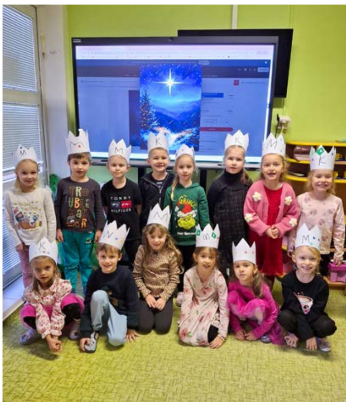
Tři králové ve školce