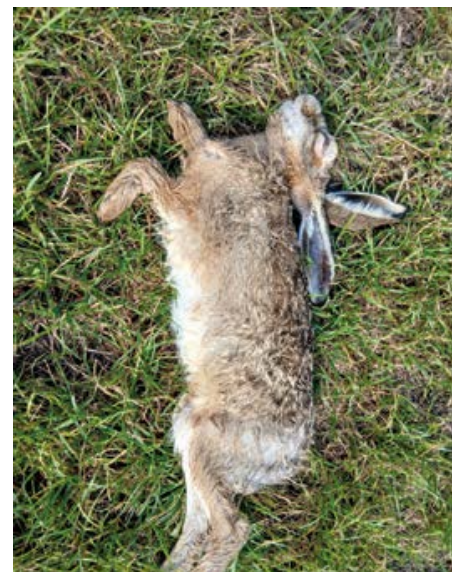
Návrat myxomatózy v jarních měsících je vysoce pravděpodobný

losti s výskytem myxomatózy u této zvěře. Jakmile se dostatečně oteplí a objeví se krev sající hmyz, lze toto celkem reálně očekávat. Pokud takové zvíře (již mrtvé nebo zjevně umírající) najdete, kontaktujte prosím někoho z místního MS. Případně je samozřejmě možné uhynulého jedince zakopat a pouze třeba poslat zprávu o úhynu. Za tuto variantu