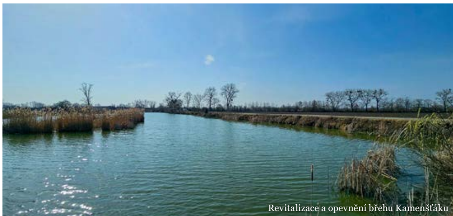
Revitalizace a opevnění břehu Kamenštáku