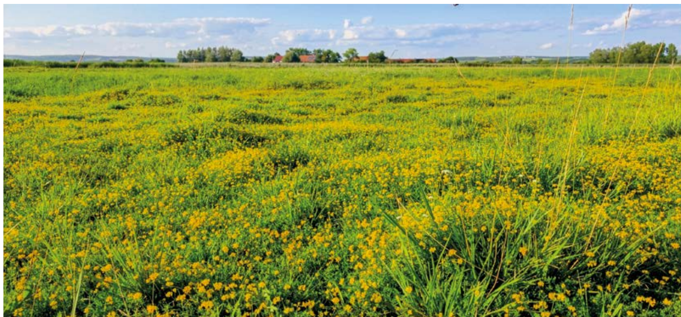
Trkmanec – Rybníčky se žlutým kobercem štírovníku tenkolistého, který snese i zasolenou půdu. Rostlina dostala své jméno podle lusků, jež po odkvětu připomínají štíří ocásek.

Biofiltr funguje tak, že voda pomalu protéká filtračním substrátem, kde dochází k rozkladu nežádoucích látek. Filtraci zajišťují bakterie a fyzikální vlastnosti materiálu, zejména velikost jeho aktivního povrchu. Jako substrát se používá například štěpka z listnatých stromů (bříza, olše, jasan) v kombinaci s příměsí biouhlu (biochar).