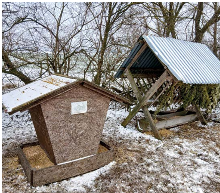
Zvěř v zimě rozhodně nestrádala