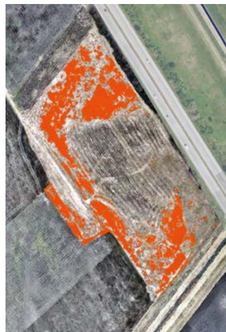
Letecký snímek Trkmanských luk s patrným zarůstáním křovinami (vyznačeno červeně), zejména svídou krvavou, jejíž šíření představuje vážný problém pro druhy lučních mokřadů, včetně vzácného pcháče žlutoostenného.

Rakvické Trkmanské louky sice nejsou rozsáhlé, ale jsou skutečně výjimečné v kontextu celé Evropy. Stojí za to je chránit a pečovat o ně. Navíc porost pcháče žlutoostenného v plném květu není pastvou jen pro včely a čmeláky, ale i pro oči. Věříme, že se nám společně povede tuto krásu a vzácnost do krajiny navrátit.