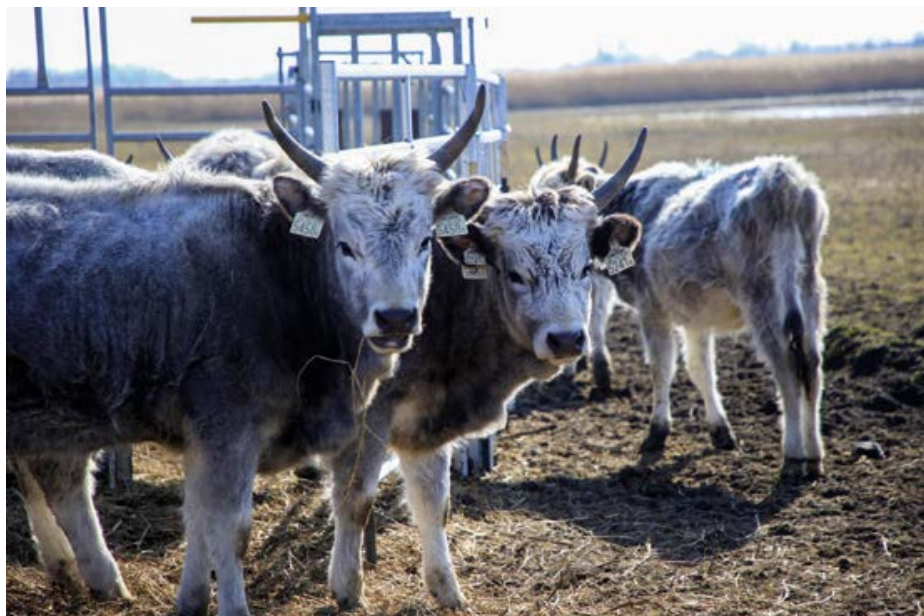
Jalovice na Trkmanci – Rybníčcích v zimním kožichu; v létě se jejich srst promění v čistě bílou.

Rozvolnění rákosin umožňuje, aby nejen rostliny, ale i ptáci a hmyz nacházeli vhodné podmínky. Rákosiny jsou důležité pro některé druhy ptáků, kterým poskytují úkryt a hnízdiště, ale zkušenosti z podobných lokalit ukazují, že i těmto druhům se daří lépe tam, kde rákosiny nejsou souvislé a kde je v okolí pestrá krajina. Hmyz, semena a další potrava se totiž v jednotvárně hustém porostu hledají obtížně. Největší rozmanitost rostlin i živočichů se obvykle objevuje v mladších rákosinách, zhruba do tří let jejich stáří. Starší porosty se příliš zahustí a hromadí se pod nimi silná vrstva staré hmoty, která se téměř nerozkládá, rok od roku je silnější a nedovolí vyrůst ničemu jinému.